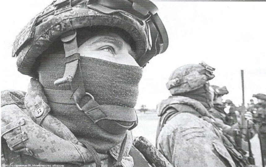
Фот. С.С. стрелков. Ил. Министерства обороны

В ближайшее время в стране предполагается призвать на военную службу 300 тысяч резервистов